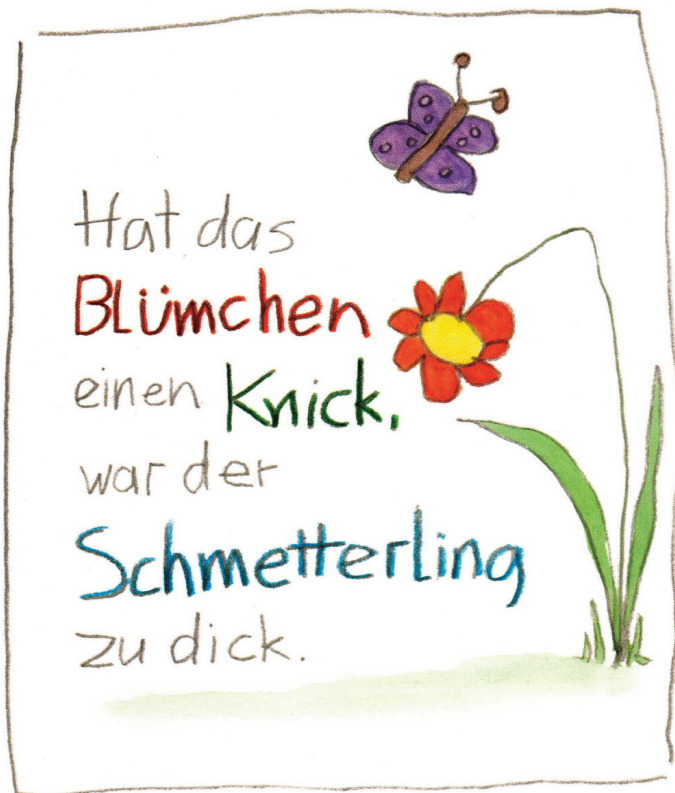
Zeichnung: Andrea Lienhart ( www.andrea.lienhart.de )

nen Verarmung der Natur, mag sie in Form von Maisfeldern auch noch so kraftstrotzend grün aussehen. Grün ist nicht gleich „gesund“, auch wenn dies uns mit großem Aufwand eingetrichtert wird....“